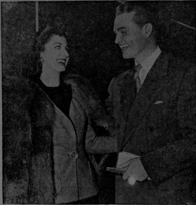
Virginia O' Brien y Red Skelton se reúnen en los Estudios de la Metro — Goldwyn — Mayer y encuentran motivo para charlar y reír.

Red Skelton sabe cómo despa- char a un "gracioso" con más prontitud que un camarero a un tacaño. Años de existencia en las variedades le han enseñado el difícil arte de hacer callar a los cómicos aficionados de entre el auditorio —aquéllos cuyo mayor placer en la vida parece ser el de interrumpir y tratar de desconcertar al artista con sus sandeces y payasadas. Existe una persona, sin embargo, que posee el don de exasperar al simpático pelirrojo hasta el límite de la paciencia.